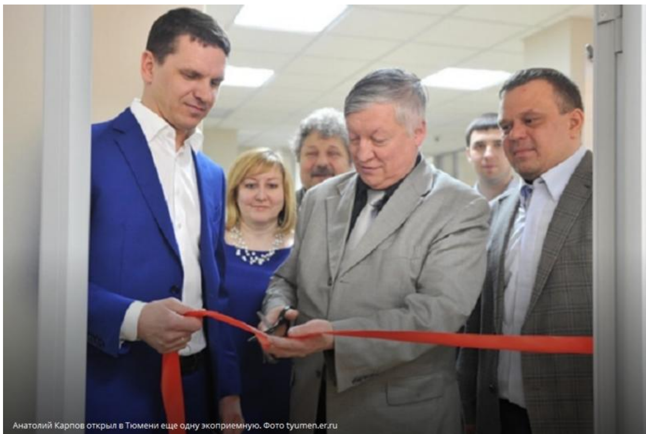
Анатолий Карпов открыл в Тюмени еще одну экоприемную.

Выдающийся чемпион подарил предприятию комплекты шахмат со своей дарственной надписью, которые тут же были «брошены» в бой с выдающимся гроссмейстером который провел сеанс одновременной игры с руководящим составом компании. Завершилось мероприятие поздравлением женщин «СБК-групп» в честь весеннего праздника 8 Марта и общей фотографией на память.